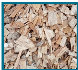
BIOMASSE (bois plaquettes ou granulés)