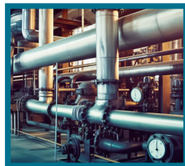
RÉCUPÉRATION DE LA CHALEUR FATALE