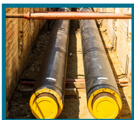
RÉSEAUX DE CHALEUR alimentés par des énergies renouvelables ou de récupération