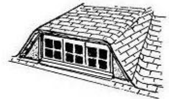
lucarne en trapèze ou rampante à jouées biaisées (couverture en bardeaux d'asphalte)

Aspect ardoise naturelle : matériau présentant des nuances de camaïeu de gris anthracite, une légère brillance, et un assortiment en facettes multiples.