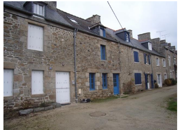
Rangé de la Vierge