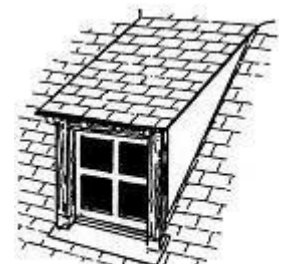
lucarne rampante ou en chien couché

Grille : Dispositif de clôture formée de barreaux métalliques verticaux, plus ou moins ouvragés. Un grillage ou treillis en panneau soudé ne répond pas à ces critères.