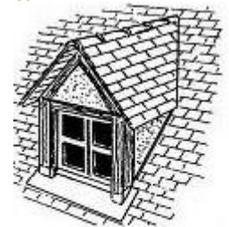
lucarne à deux pans dite jacobine, en bâtière ou à chevalet