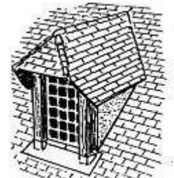
lucarne à demi-croupe, dite normande