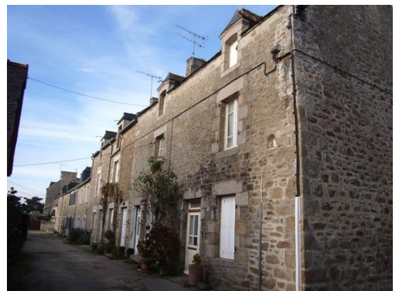
Rangé de la Vierge