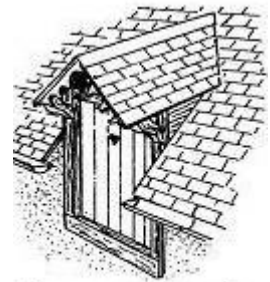
lucarne pendante, dite meunière, ou gerbière