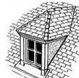
lucarne à croupe, dite capucine ou "à la capucine"